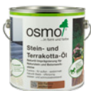
Stein- und Terrakotta-Öl

Dadurch, dass das Imprägnier-Öl frei von bioziden Wirkstoffen ist, kann es auch unbedenklich im Bereich von Lebensmitteln verwendet werden, z.B. bei Stein von Grills.