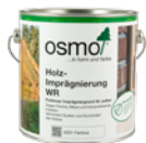
Holz- Imprägnierung WR