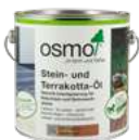
Stein- und Terrakotta-Öl

Dadurch, dass das Imprägnier-Öl frei von bioziden Wirkstoffen ist, kann es auch unbedenklich im Bereich von Lebensmitteln verwendet werden, z.B. bei Stein von Grills.