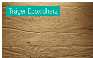
2512 Old Nature Epoxidh., Asteiche Format: 1.100 x 2.400 x 5,5 mm ArtikelNr.: 010010000000462