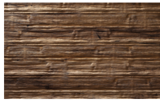
2468 Spalt Altholz Eiche Format: 2.450 x 1.050 x 21 mm ArtikelNr.: 050010000000216