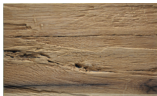
2652 Rustic Wood Altholz Eiche Format: 2.450 x 1.050 x 18,5 mm ArtikelNr.: 010010000000450