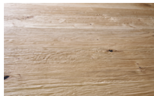
2578 Rough Old Wood Eiche Rustik. Format: 3.135 x 1.270 x 18,5 mm ArtikelNr.: 050010000000220