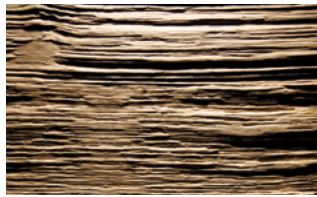
2468 Spalt Asteiche Format: 2.450 x 1.050 x 21 mm ArtikelNr.: 050010000000217