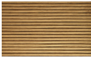
2651 Stripes Asteiche Format: 3.135 x 1.270 x 18,5 mm ArtikelNr.: 010010000000449