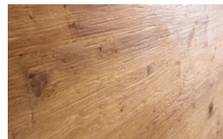
2578 Rough Old Wood Altholz Eiche Format: 3.135 x 1.270 x 18,5 mm ArtikelNr.: 050010000000219