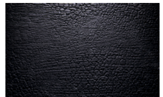
2588 Burned Wood schwarz roh Format: 3.135 x 1.270 x 19,5 mm ArtikelNr.: 050010000000221