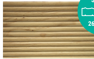
2636 Cave Asteiche Format: 2.450 x 1.050 x 18,5 mm ArtikelNr.: 010010000000448