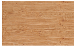
2491 Antikwood Roseneiche Format: 3.135 x 1.270 x 18,5 mm ArtikelNr.: 050010000000218