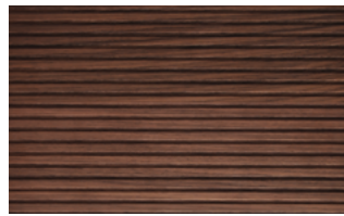
2651 Stripes Kernussbaum Format: 3.135 x 1.270 x 18,5 mm ArtikelNr.: 010010000000453