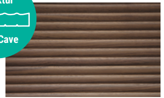
2636 Cave Kernussbaum Format: 2.450 x 1.050 x 18,5 mm ArtikelNr.: 010010000000452