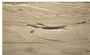
2652 Rustic Wood Asteiche Rustik. Format: 2.450 x 1.050 x 18,5 mm ArtikelNr.: 010010000000451