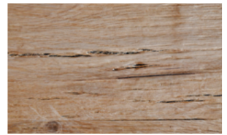
2511 Blockwood Eiche Rustikal Format: 3.135 x 1.270 x 21 mm ArtikelNr.: 010010000000446