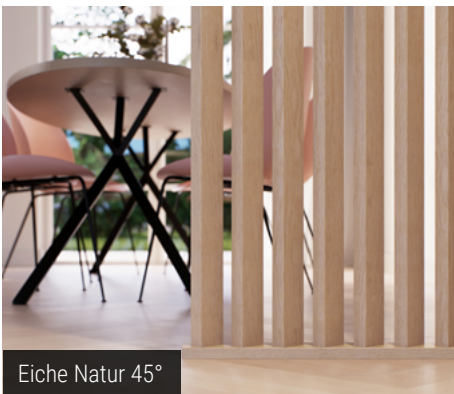
Eiche Natur 45°