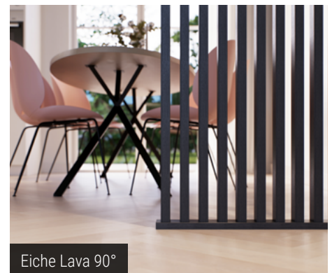
Eiche Lava 90°