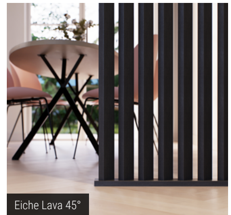
Eiche Lava 45°