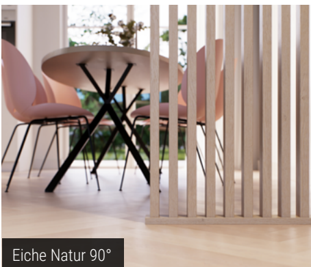
Eiche Natur 90°